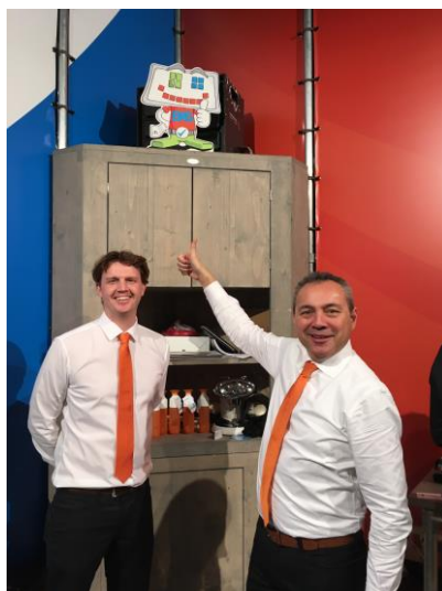
Bij Valk Solutions is BAS standaard aanwezig. Dit keer in de Jaarbeurs Utrecht.