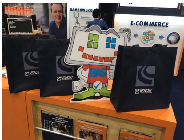
BAS in de stand van Vendit

Copyright © *2018|* *Keurmerk Betrouwbare Afreken systemen|*, All rights reserved. U krijgt deze nieuwsbrief omdat u of uw organisatie belangstelling heeft getoond voor het werk van de stichting Betrouwbare Afreken systemen