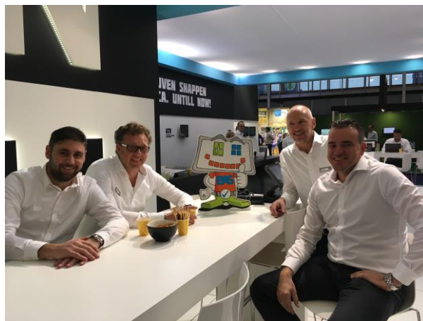
BAS op bezoek bij UnTill en haar resellers

BAS was de afgelopen periode weer volop in het land te vinden. Zo was hij aanwezig op de Horecava, de Webwinkelvakdagen en de beurs Trends. Wij delen graag een impressie met u.